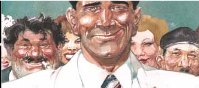
Dessin : François Boucq